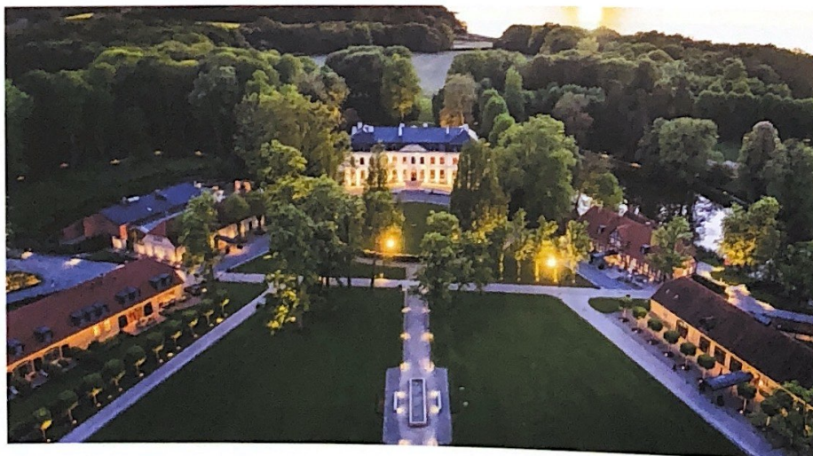
Oben Beach-Cabana mit Blick auf den Privatstrand. Links Die weitläufige Schlossanlage. Rechte Seite Sonnenbalkon, Behandlungsraum für Paare und Deluxe-Room in der Villa Stephanie.